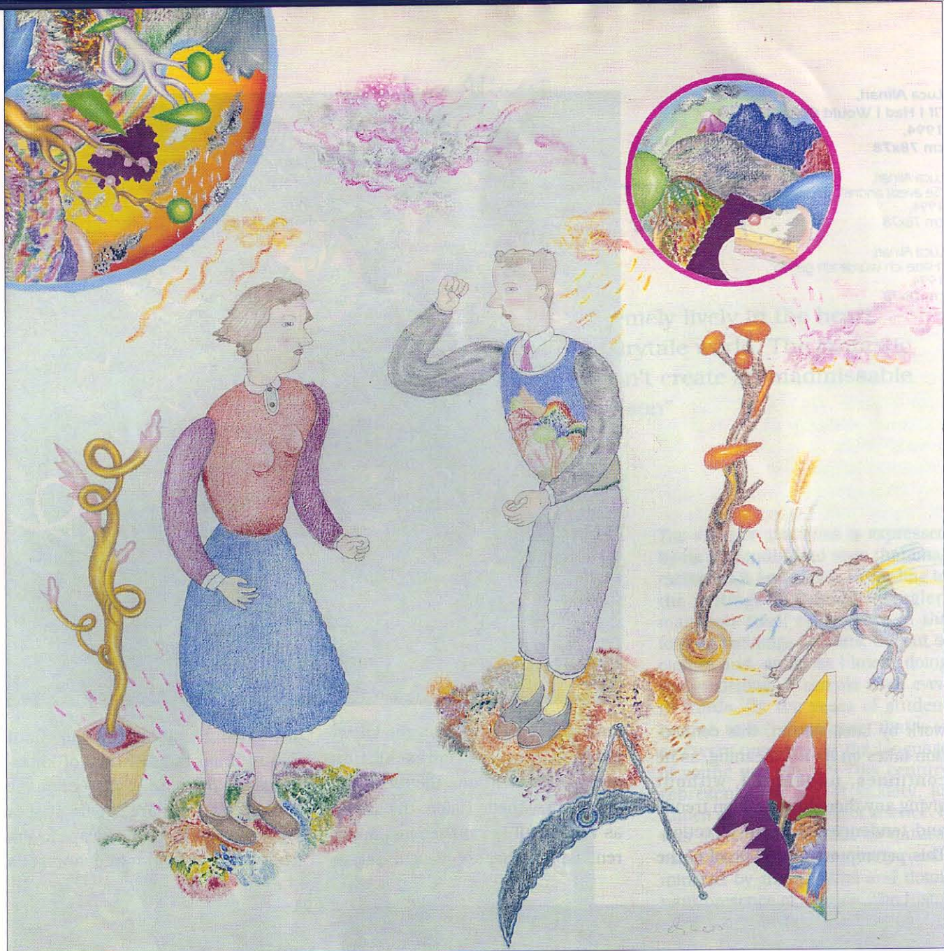
Luca Alinari, "To Stay With, I Care For", 1994, cm 80x80

Luca Alinari, "Stare con, tengo per", 1994, cm 80x80