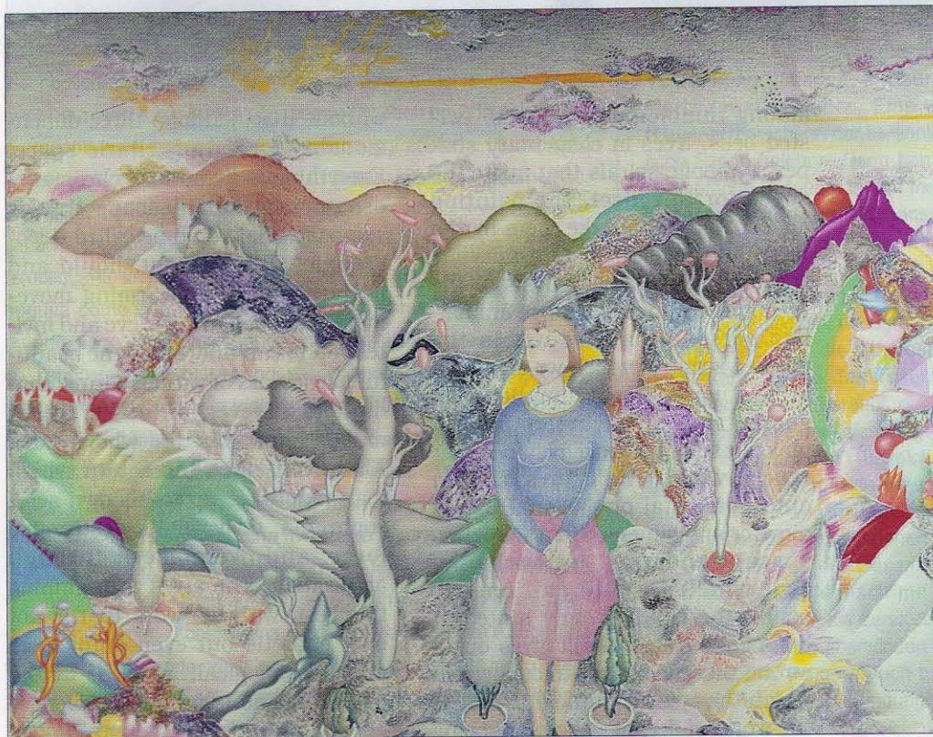
Luca Alinari, "Hired Assassins Are Rewarded", 1993, cm 140x110

a painting that intends to distil beauty from the test tube of knowledge. At the core of the chromatic shipwreck, there are square shapes by Alinari, in those landscape layers that melt into flooded horizens