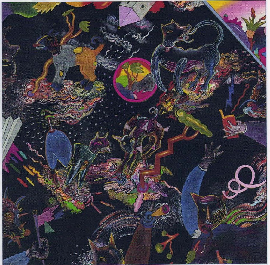
Luca Alinari, "Hätte ich würde ich gehen", 1994, cm 78x78

work by Luca Alinari, this connection takes on its full meaning, as he continues, undaunted, without giving any thought to fashion trends and tendencies; a main direction. This peremptory gest - proof of the