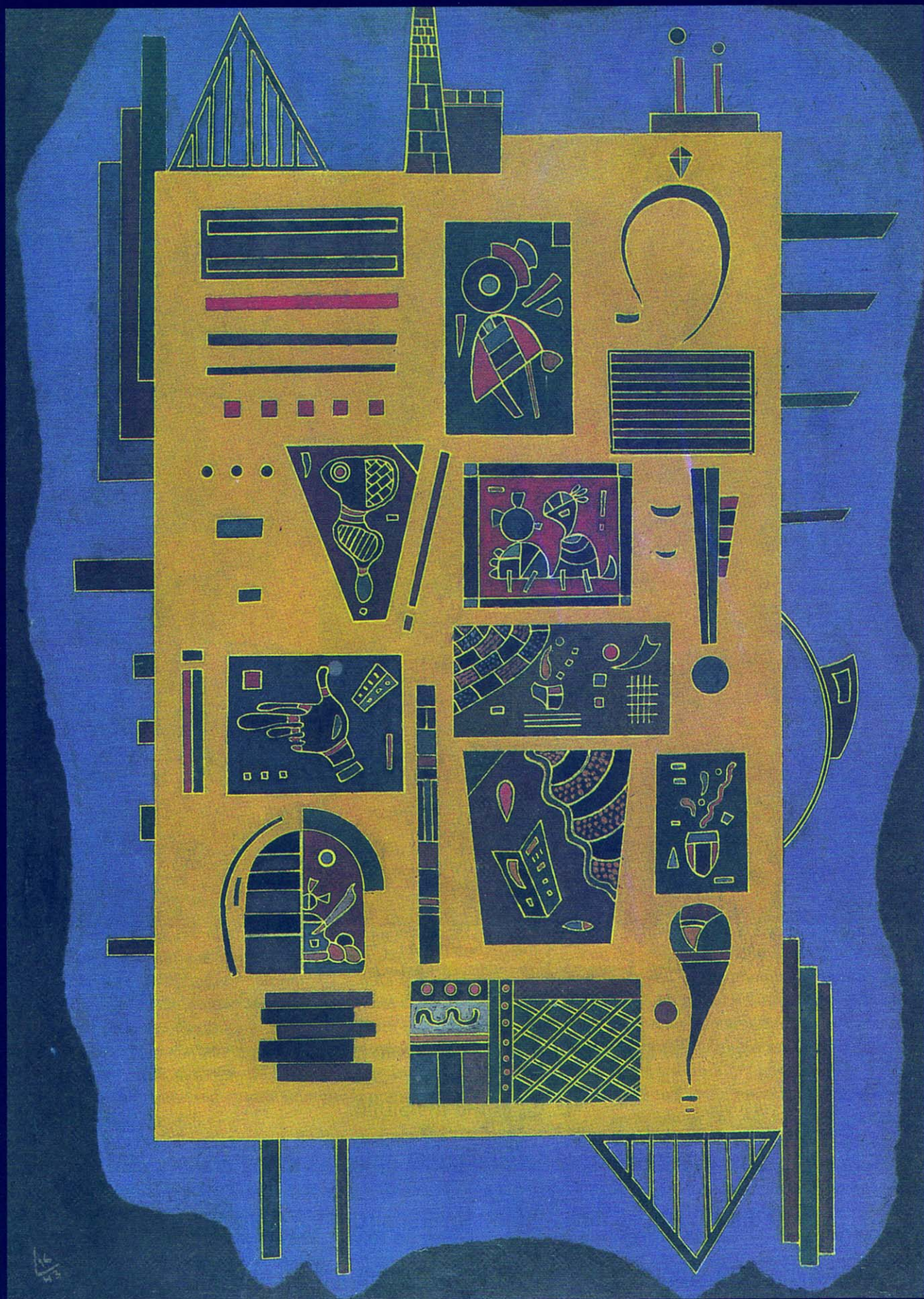
Sopra: "Un conglomerato", 1943, tempera e olio su cartone, cm 58x42 Nella pagina accanto: "Dolci bagatelle", 1937, olio e acquerello su tela, cm 60x25,