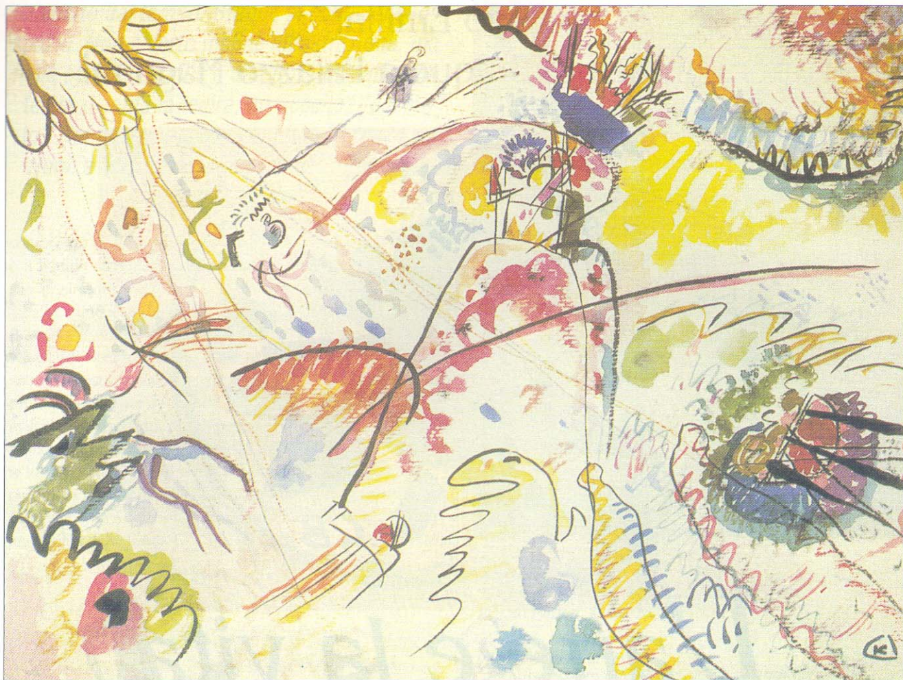
"Studio per Piccole gioie", 1913, acquerello e inchiostro di china su carta vergata, cm 23,8x31,5

all'ultima fase a Parigi, che é caratterizzata da una figurazione leggera, preziosa e non esente da suggestioni surrealiste.