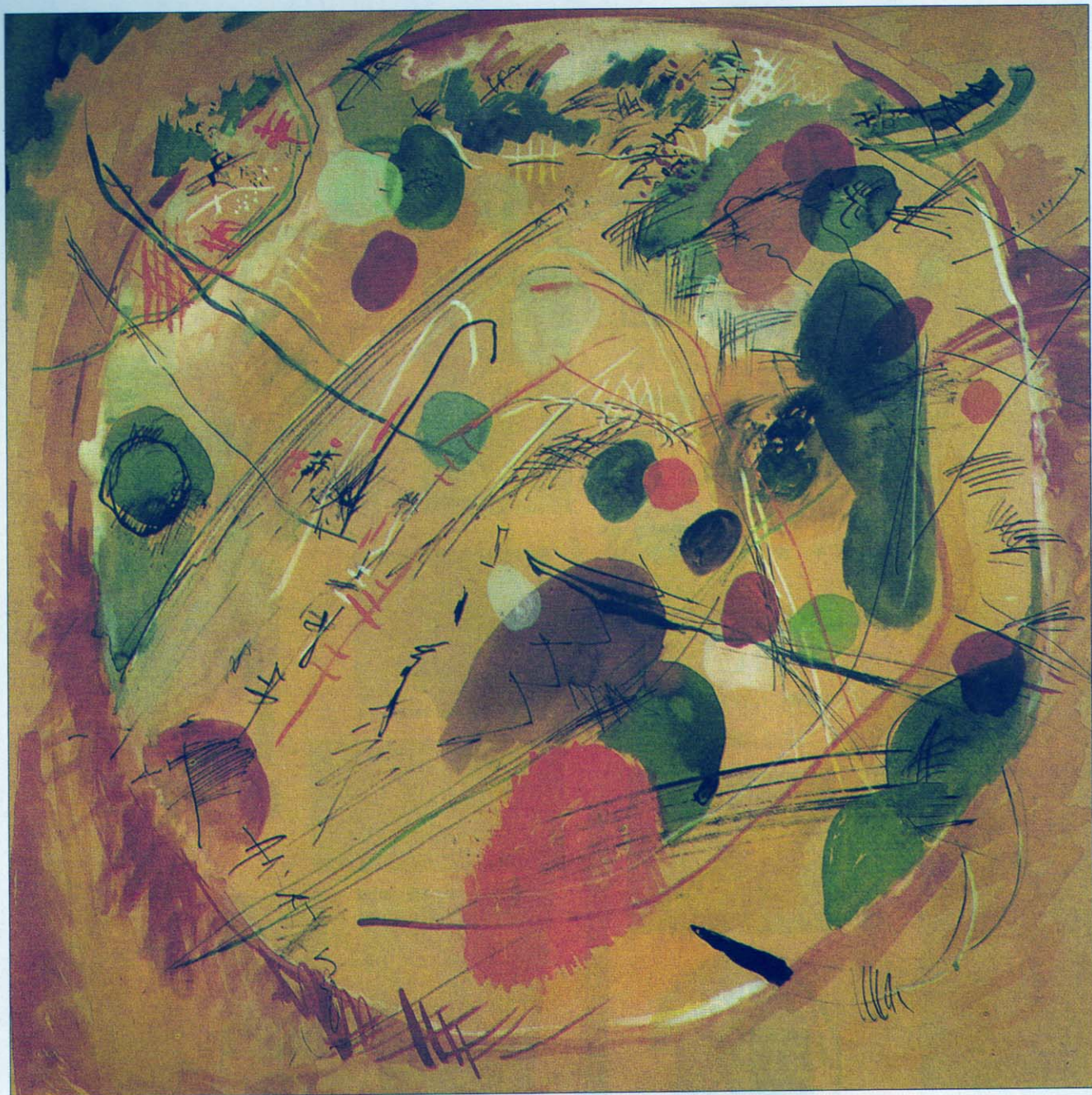
"Nel cerchio", 1913/14, acquarello, tempera e inchiostro di china su carta marroncina, cm 48,9x48,5