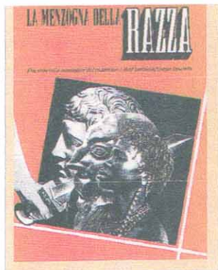
Locandina della mostra

DAL 14 DICEMBRE è possibile ammirare al Museo Morandi di Bologna (Tel: 051/203332) "Natura morta", proveniente dalla Fondazione Magnani Rocca di Mamiano di Traversetolo (Pr), splendido esempio della breve stagione metafisica di Morandi: lo scorso novembre è stato invece presentato, nella rinnovata Sala Farnese di Palazzo D'Accursio, il Catalogo Generale dei Disegni di Giorgio Morandi, curato da Marilena Pasquali e Efrem Tavoni (Electa). Dopo l'Archiginnasio di Bologna, la mostra "La menzogna della razza. Documenti e immagini del razzismo e antisemitismo fascista", ricostruzione mologica di una tragedia storica affatto superata, farà tappa in numerose città italiane tra cui, probabilmente, Milano, Ancona, Firenze, Venezia e Sassari. Anche la precedente mostra "Combat photo: 1944-1945", curata anch'essa dalla Soprintendenza ai Beni Librari e Documentari della Regione Emilia Romagna, prosegue il suo itinerario tra i comuni emiliani. Per queste iniziative telefonare allo 051/226610.