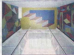
Sol LeWitt, Wall Drawing #573, figura isometrica con inchiostri colorati ad acqua, m 9, 44x5, 78 iColi. Ulrich Ruckriem, Francoforte)

LE GRANDI SALE DELLA GALERIE Verneuil e, soprattutto, della Renn Espace d'Art Contemporain si adattano perfettamente ad ospitare i grandi e multicolori wall drawings (disegni murari) che l'artista americano Sol LeWitt fa rieseguire per una completa retrospettiva dei 25 anni della sua produzione. LeWitt, proprio perchè artista di punta del Minimalismo e del Concettualismo, sin dai primi anni '60 ritiene preponderante l'aspetto teorico, analitico dell'opera d'arte. Nella sua concezione operativa l'idea ed il progetto sono prioritari; il compimento effettivo dell'opera è demandato invece, in un secondo momento, a semplici esecutori. E, ad esecuzione avvenuta, si assiste ad una singolare coincidenza linguistico-rappresentativa: il titolo dell'opera equivale, infatti, tautologicamente, a ciò che essa rappresenta. Come un grande compositore musicale, per ogni sua opera LeWitt si limita a stendere la partitura e a numerarla progressivamente,