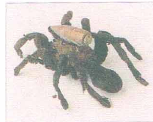
Jan Fabre. Insetto-scultura. 1979

E' STATA INAUGURATA alla rme di novembre questa esposizione-installazione di Jan Fabre, giovane artista belga fra i più interessanti del momento. Intelligentemente disposte nelle diverse sale del Museo Pecci, le sue opere danno un'impressione d'insieme molto suggestiva, a cominciare dalla prima sala, dove sono "ancorate", come barche in un molo, sette vasche da bagno "maniacalmente" colorate con una biro blu, alla stessa maniera dei sette guffi di vetro appesi di fronte a ciascuna di esse. Altra installazione assai interessante è "Tetti Tivoli". Un discorso a parte meritano i vestiti e gli oggetti costruiti attraverso il "montaggio", su una rete metallica, di centinaia e centinaia di scarabei che nell'immaginario dell'artista sono come dei "messaggeri che hanno ricoperto il corpo fittizio"; per l'autore l'insetto è spunto di infinite fantasie, spesso metafora delle forze oscure latenti nell'uomo. Da ultimo, le enormi carte blu tracciate con la solita biro che, come scrive Lara Vinca Masini. "rappresentano la vitalità di un informale finissimo che è anche esibizione di una violenza, di un abuso di se stesso ..."